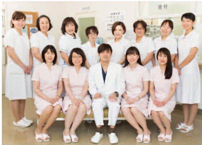
石院長を中心に、チームワーク抜群な明るい笑顔のスタッフが、優しくいねいかつ迅速な対応をしてくれる。