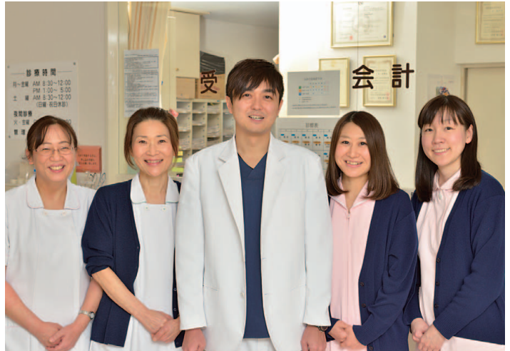
ドクターを含めてスタッフは全7人。優しく丁寧な対応が好評!

消化器疾患の早期発見・治療に力を入れ、苦痛の少ない検査を推進。胃カメラには経鼻内視鏡、大腸カメラは最新式ファイバースコープなど先端の医療装置を採用し、希望に応じて鎮静剤も使っていき、胃がんや大腸がんの早期発見をはじめ、胃潰瘍やピロリ菌感染、性胃炎、大腸ポリープや虚血性腸炎、潰瘍性大腸炎の治療にも実績多数。また、「健康長寿」を目指すアンチエイジング医療にも注目し、プラセンタ注射なども行っている。